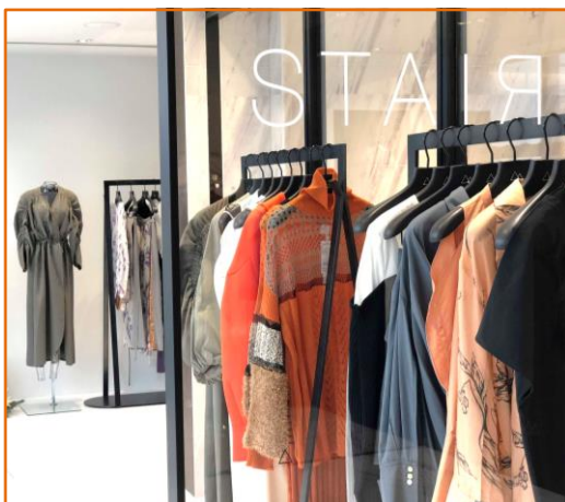
STAIR 武笠綾子 KASHIYAMA DAIKANYAMA 2019 年秋冬 POP-UP