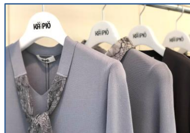
KÄÄPIÖ 大島郁 2020 年春夏展示会