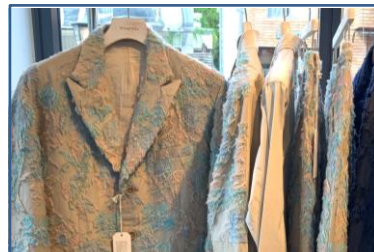
meagratria 関根隆文 2020 年春夏展示会