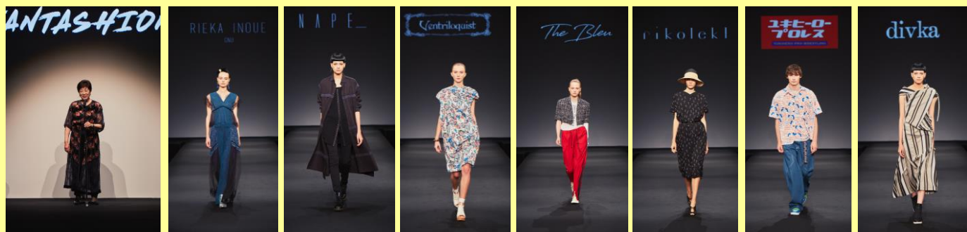
RIEKA INOUE GNU をまとう小池都知事