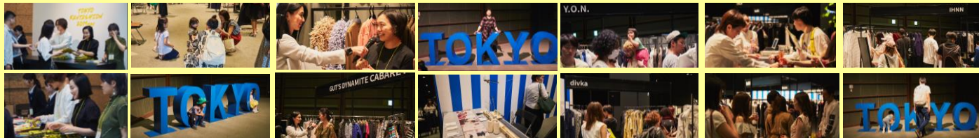
ロビー展示：産地コラボ