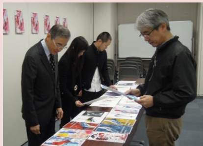
作品を審査する先生方