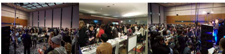
会場は来場者で溢れ、活気あふれるイベントになりました。