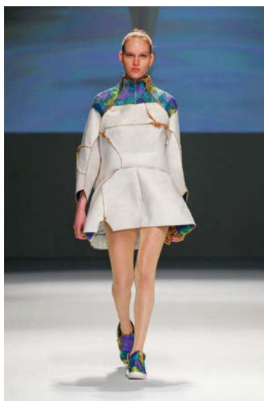
大賞 ファン ティ カム トウ 上田女子服飾専門学校