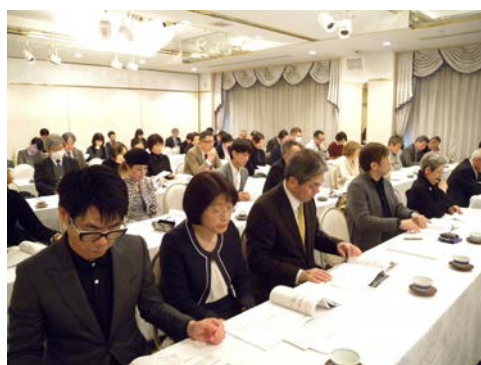
前年度の成果報告会の様子。約 100 名の方にお越しいただいた。