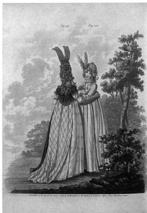
1796年6月号 朝のドレス