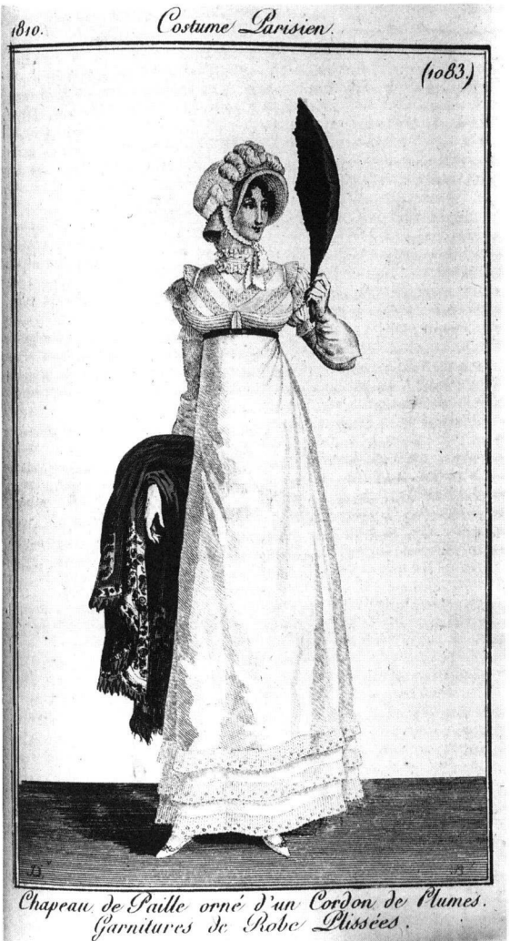
Chapeau de Paille orné d'un Cordon de Plumes. Garnitures de Robe Plissées.