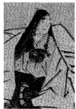
図4 鶴岡放生會職人盡歌合