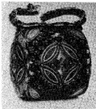
図1 懸守 (四天王寺蔵)