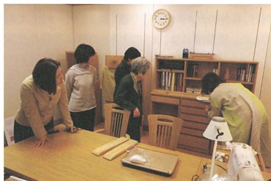
専門有識者による収納システム評価の様子

すいガイドなど)についての関心が高かった。一方、取り外して手にするものの軽量化などの課題点もあげられた。